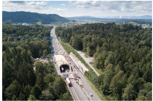
Luftbild während der Montage