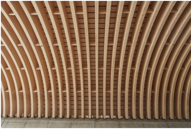
Die Holzkonstruktion bleibt von unten sichtbar