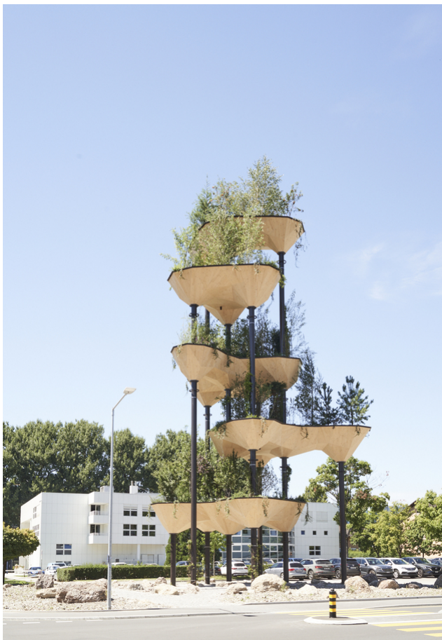
Semiramis im Herzen des Tech Cluster