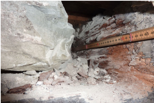
Deckenbalkenstütze in der Aussenwand im Weinkeller vor der Sanierung