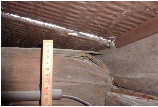
Unterstützung für Weinkellerbalken vor der Sanierung