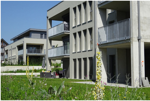
Aussenansicht fertige Überbauung