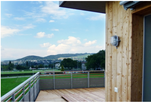
Haus C Terrasse mit Aussicht