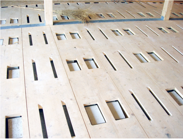
Füllen der Öffnungssignatur Stille