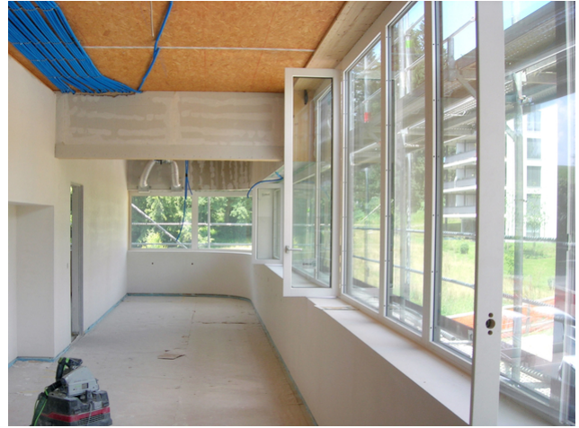
Arbeitsnische mit auskragendem BSH Unterzug