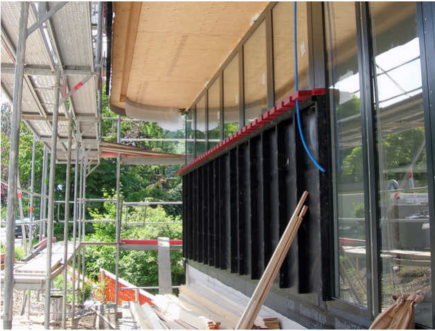
Auskragende Geschossdecke im Bereich des Zugangs