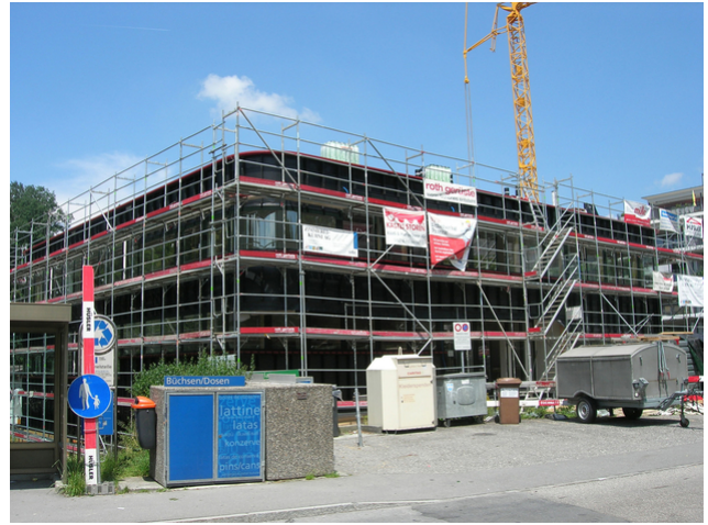
Aussenansicht von der Büthenbergstrasse