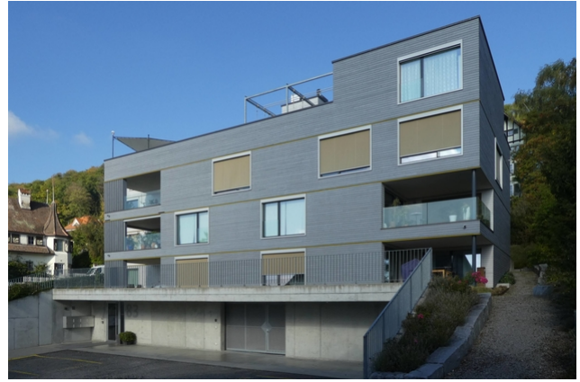
Ansicht nach 6 Jahren