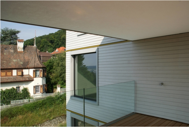
Die Terrasse