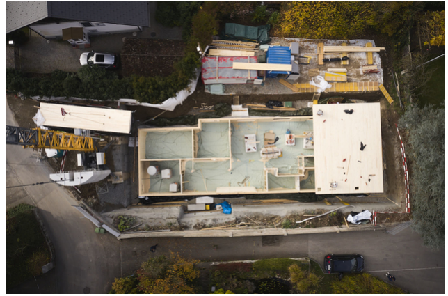
Flugaufnahme Untergeschoss aus Holz