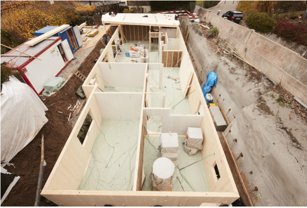
Untergeschoss aus Holz