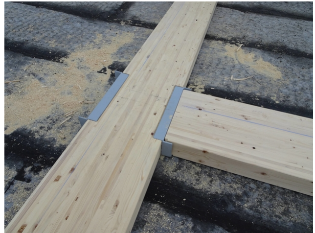
Kreuzung von Trägern