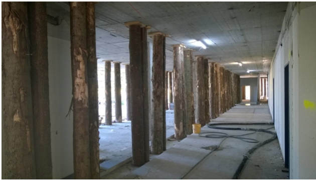
Provisorische Unterstützung mit Baumstämmen