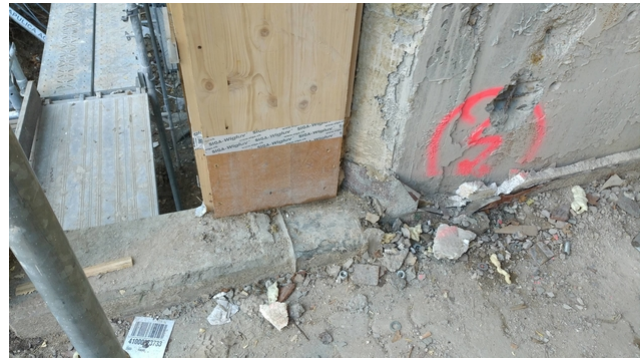
Anschluss der Holzkonstruktion an die bestehende Betonteile