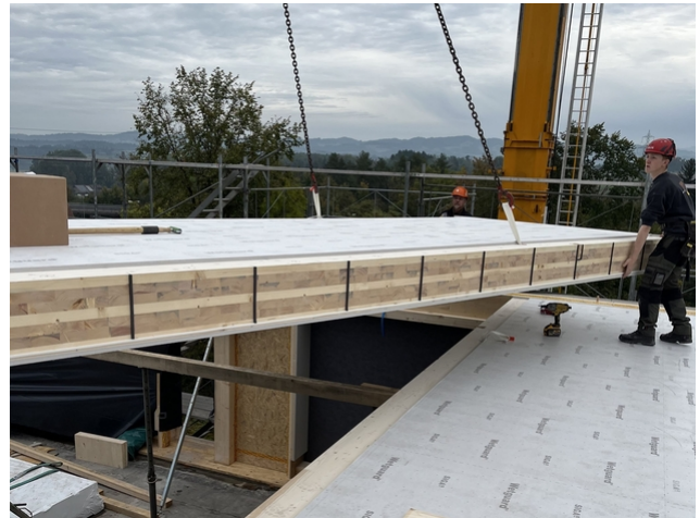
Längsseitig vorbereitete CLT-Platte beim Aufrichten vor TS3 Fugenvergross.