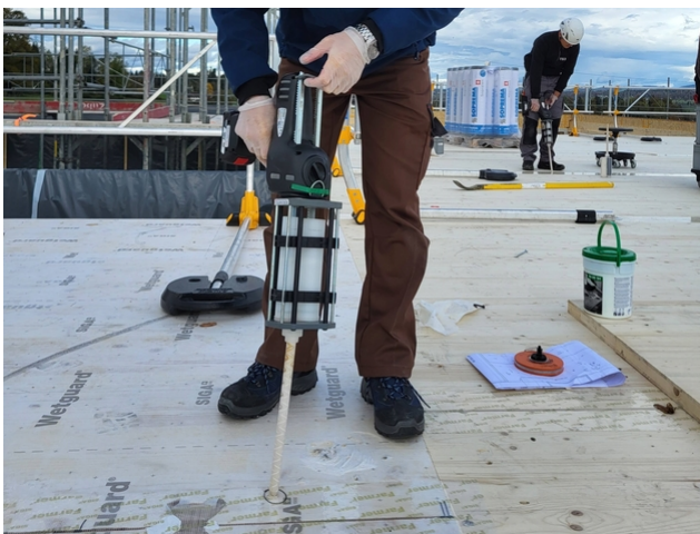
Der TS3-Fugenvergross wird bauseits beim Aufrichten umgesetzt.