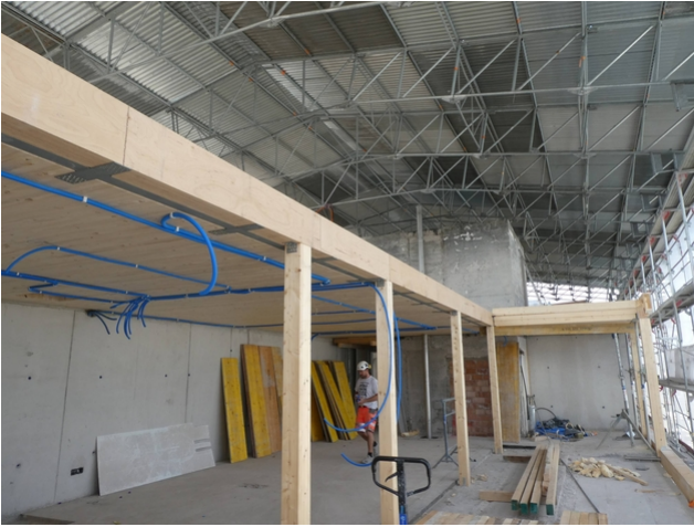
Aufstockung unter dem Notdach