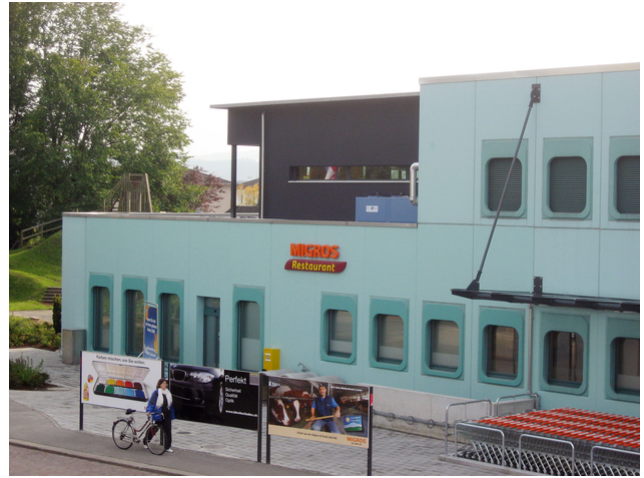
Ansicht Nordseite mit Lichtband