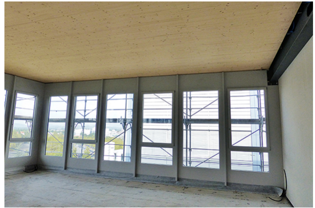
Holzdecke mit 9m Spannweite