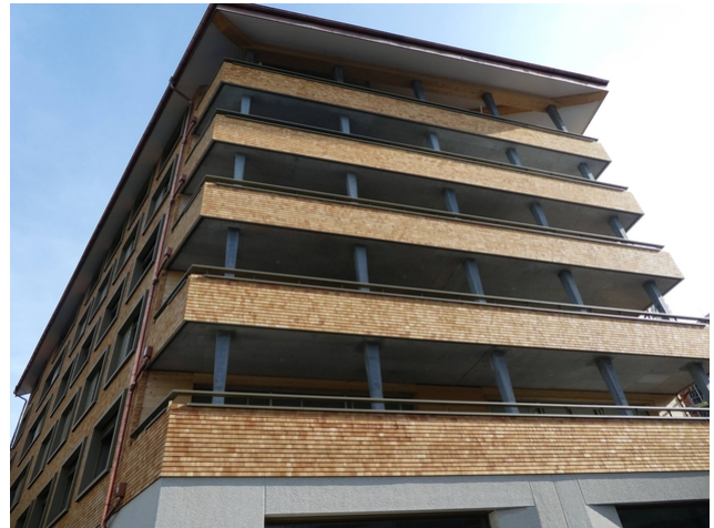
Appartementshaus Wolf: Bedeckt mit Holzschindeln von oben nach unten