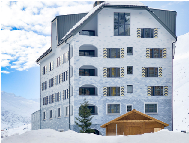
Schwerlast-Dächer: Timbatec plante die Dachkonstruktionen