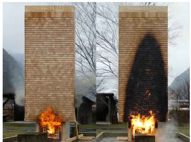
Ein Brandversuch der Schindelfassade