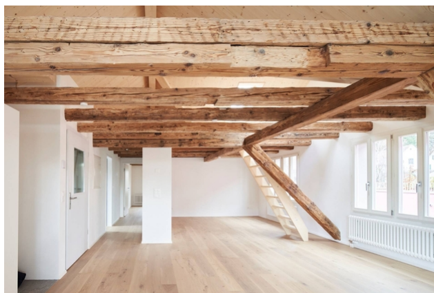
Chambre (avec montée)