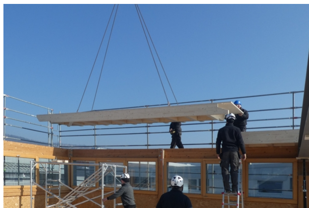
Pose d'un élément de toiture