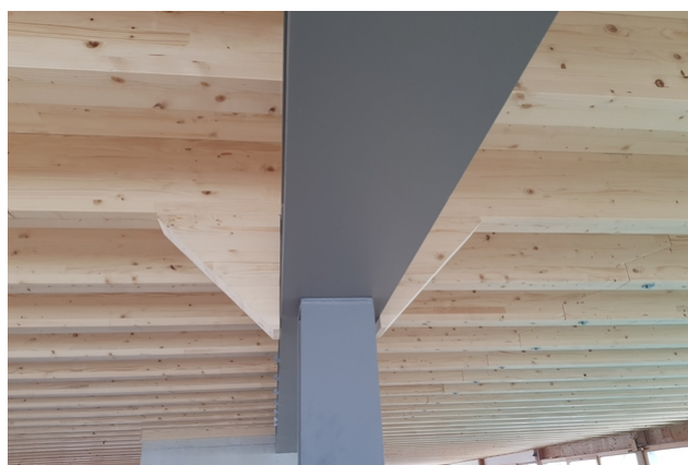
Combinaison de la structure porteuse métallique et de la construction bois