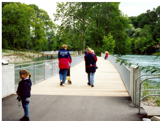
Le début du pont