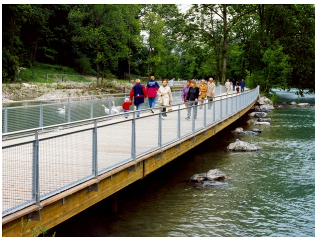
Chemin piétonnier en service