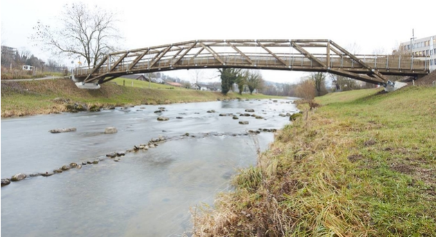
Le nouveau Tüfisteg