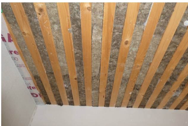
Isolation du plafond dans la rénovation de la grange.