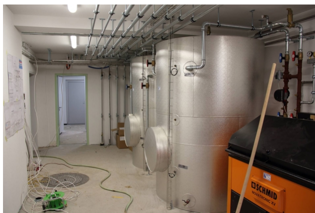
Les services du bâtiment et le revêtement extérieur sont coordonnés.