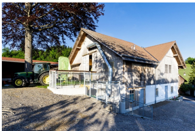
Vue extérieure de la grange rénovée.