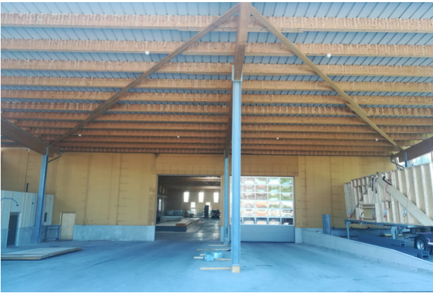
Auvent du hall de production