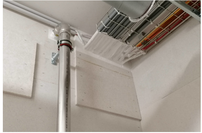
Cloisonnement du local technique