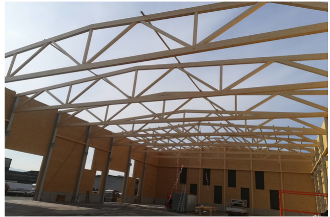
Montage hall de production