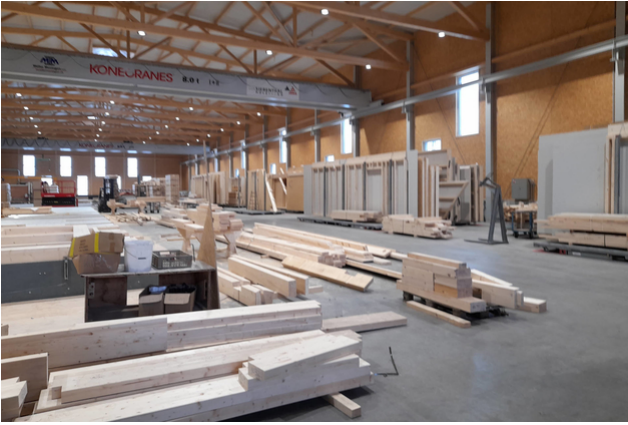
Vue intérieure du hall de production